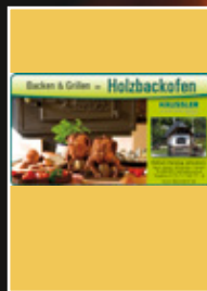
Häussler GrillMagazin 01/2011