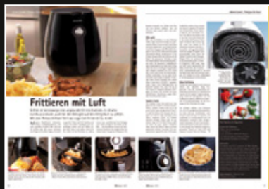
Philips Advertorial GrillMagazin 01/2011