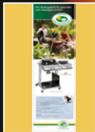
Outdoorchef GrillMagazin 01/2011