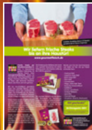
Gourmetfleisch.de GrillMagazin 03/2011