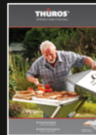
Thüros GrillMagazin 01/2011