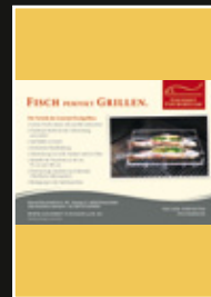
Gourmet-Fischgriller GrillMagazin 01/2011