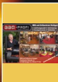
BBQ-Profi GrillMagazin 01/2011