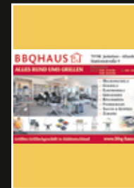
BBQHaus GrillMagazin 01/2010