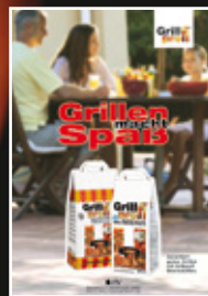
Rheinbraun GrillMagazin 01/2011